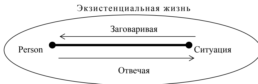
Рис. 1. Человек отправляется в экзистенциально-осмысленный обмен с миром, если он общается с миром диалогично

Благодаря обращению к миру с его возможностями и открытой встрече с ним, возникает основополагающий диалогический характер человеческой экзистенции .